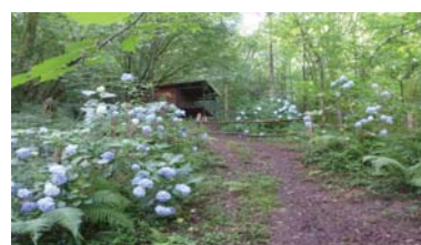
Thoreau espazioa Espacio Thoreau

Presentación del libro: Una casa en Walden (Editorial pepitas). En el 200 aniversario del nacimiento de Henry David Thoreau e inauguración del restaurado "Thoreau space".